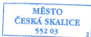
Ing. Jiří Fišer vedoucí finančního odboru

Tabulka část A (Příloha č. 7 k vyhlášce č. 367/2015 Sb.) – Ministerstvo kultury (ÚZ 340xx) Tabulka část A (Příloha č. 7 k vyhlášce č. 367/2015 Sb.) – Ministerstvo vnitra (ÚZ 14004) Tabulka část A (Příloha č. 7 k vyhlášce č. 367/2015 Sb.) – Ministerstvo vnitra (ÚZ 14036) Tabulka část A (Příloha č. 7 k vyhlášce č. 367/2015 Sb.) – Všeob. pokl.správa (ÚZ 98071) Avízo vratek – částečná vratka dotace na volby - (ÚZ 98071)